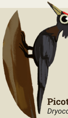
Picot negre Dryocopus martius