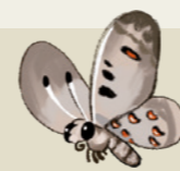
Papallona Apol·lo Parnassius apollo