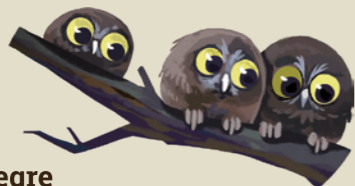
Mussol pirinenc Aegolius funereus