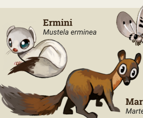
Ermini Mustela erminea