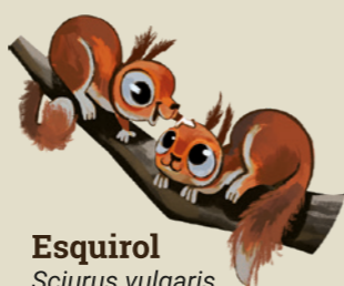
Esquirol Sciurus vulgaris