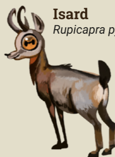
Isard Rupicapra pyrenaica